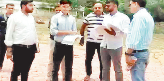
अधिकारियों से चर्चा करते विधायक।

बता दें कि नगर पंचायत को वर्ष 2020-21 में 38.93 लाख की लागत से झोर तालाब सौंदर्यीकरण एवं 14.89 लाख की लागत से मालिपारा से कॉलेज पहुंच मार्ग सीसी सड़क निर्माण की स्वीकृति प्रदान की गई थी। तालाब सौंदर्यीकरण और सीसी सड़क निर्माण के लिए निविदा जारी की गई और टेंडर प्रक्रिया की औपचारिकता के बाद ठेकेदार द्वारा काम शुरू कराया गया। सौंदर्यीकरण कार्य के तहत नगर पंचायत का झोर तालाब को चौपाटी की तर्ज पर विकसित करने का प्लान था ताकि नगरवासी अपने परिवार के साथ यहां आकर सुकून के साथ कुछ पल बिता सकें। इसके लिए ठेकेदार को बकाया 17 लाख रूपए जारी भी कर दिया गया। नगर पंचायत द्वारा राशि जारी करने के बाद झोर तालाब में सौंदर्यीकरण का काम बड़ी तेजी से शुरू किया गया लेकिन कुछ