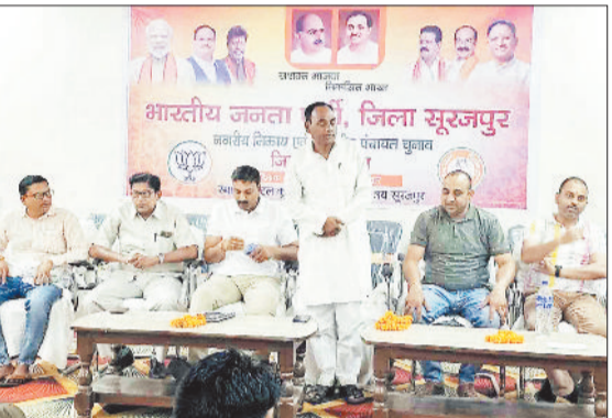
बैठक में शामिल भाजपा पदाधिकारी।

भारतीय जनता पार्टी जिला कार्यालय अटल कुंज में 13 मई को 11 बजे सरगुजा संभागीय मुख्यालय अंबिकापुर स्थित पीजी जे ले ग्राउंड में आमसभा कार्यक्रम में मध्य प्रदेश सरकार के पूर्व मुख्यमंत्री एवं केंद्रीय कृषि मंत्री शिवराज सिंह चौहान के आगमन की तैयारियों को लेकर भाजपा शहर एवं ग्रामीण मंडल की संयुक्त आवश्यक बैठक सम्पन्न हुई। बैठक में सभी पदाधिकारियों एवं कार्यकर्ताओं को बृथ वार व शक्ति केंद्र वार मंडल स्तर पर दो हजार का लक्ष्य देते हुए अधिक से अधिक संख्या में मोर आवास मोर अधिकार आवास प्लस आमसभा कार्यक्रम में सम्मिलित होने कहा है। साथ ही आगामी कार्यक्रमों के संबंध में भी विस्तार पूर्वक चर्चा की गई।