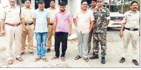
पुलिस गिरफ्त में आरोपी।

पहाड़ी कोरवा ग्रामीण की जमीन को फर्जी दस्तावेजों के आधार पर हथियाने और उसे प्रताड़ित कर आत्म हत्या के लिए मजबूर करने के मामले में पुलिस की कार्रवाई जारी है। पुलिस लगातार भूमाफियाओं पर शिकंजा कस रही है। पुलिस ने अब इस मामले में तीन अन्य आरोपियों को गिरफ्तार किया है जबकि पूर्व में तीन आरोपियों को पकड़कर जेल भेजा गया था। पकड़े गए आरोपियों में एक पटवारी भी शामिल है। इस हिसाब से अब तक छह आरोपियों की गिरफ्तारी हो चुकी है जबकि मुख्य आरोपी व उपपंजीयक अभी भी पुलिस की गिरफ्त से बाहर बताए जा रहे हैं। बड़ी बात यह है कि आरोपियों ने ग्रामीण की जमीन को 14 लाख रूपए में सौदाकार फर्जी तरीके से खरीद लिया था। बता दें कि