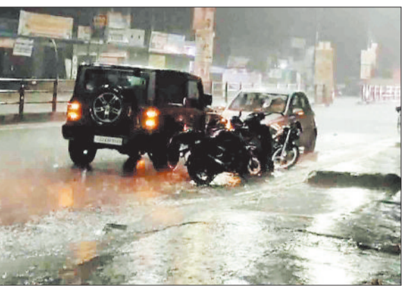
बारिश से तरबतर सड़क।

विभिन्न राज्यों में सक्रिय मानसून घटकों के बीच पश्चिम की गर्म हवा के थपड़े शुरू हो गए हैं ऐसे में आने वाले समय में लोगों को दोपहर तक भीषण गर्मी एवं शाम में तेज रफ्तार अंधड़ के साथ बेमौसम बारिश का सामना करना पड़ सकता है। मौसम विभाग ने इस संबंध में अलर्ट भी जारी किया है। वर्तमान में दक्षिण-पश्चिम मानसून उष्ण क्षेत्र से भारत की ओर अग्रसर है तथा मौसम विज्ञानियों ने अण्डमान सागर में दस्तक देने की संभावना जताई है। पिछले साल भी केरल तट पर मानसून ने दस्तक 29 मई को दे दी थी लेकिन सरगुजा तक पहुंचने में काफी विलम्ब हुआ था। मंगलवार से जेट